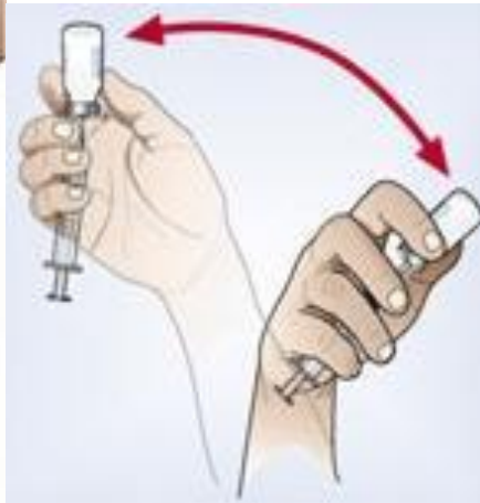
Výmena perforačnej ihly za aplikačnú