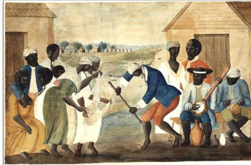
„The Old Plantation (Stará plantácia)“, anonymný autor.

Džez vznikol začiatkom 20. storočia v USA, v meste New Orleans, ktoré sa nachádza v štáte Louisiana. Vznikol postupným zlúčením afrických kmeňových hudobných tradícií a afroamerického folklóru (najmä bluesu) s európskymi hudobnými tradíciami.