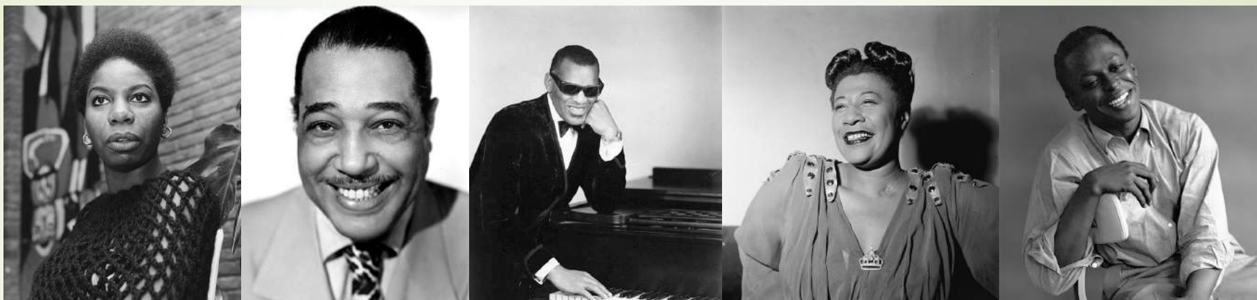
Viacerí známy džezový hudobníci: (odľava doprava) Nina Simone, Duke Ellington, Ray Charles, Ella Fitzgerald a Miles Davis.