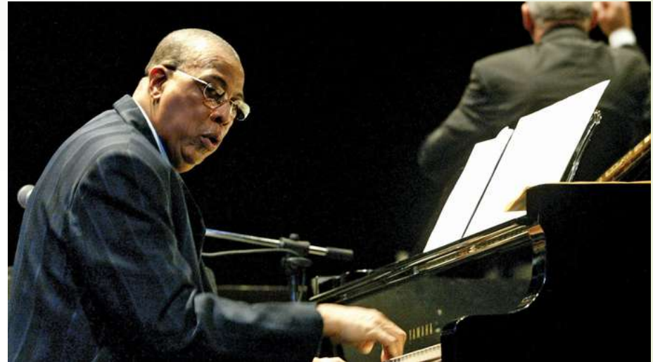
Jesús Valdés Rodríguez, lepšie známy ako Chucho Valdés , hrajúci na klavíri v roku 2005. Chucho je známy afro-kubánsky džezový hudobník a zakladateľ kubánskej džezovej skupiny Irakere .

Na konci 60. rokov 20. storočia latinsko-americký džez, kombinujúci rytmy z afrických a latinsko-amerických krajín, prerazil do popularity. Existujú dve hlavné odrody latinsko-amerického džezu: afro-kubánsky džez, hraný v USA hneď po 50. rokoch 20. storočia a brazílsky džez, pochádzajúci hlavne zo samby, ktorý sa stal populárnejším v 60. rokoch toho istého storočia.